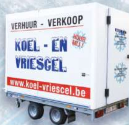
KOELCEL 7,5 M 3 DUBBELE AS