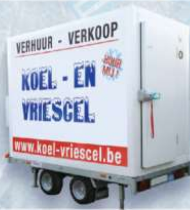
KOEL - EN VRIESGEL 7,5 M 3 DUBBELE AS