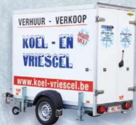
KOELCEL 6,5 M 3 ENKELE AS