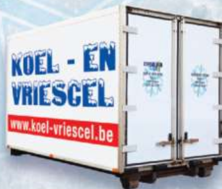
KOELCONTAINER 16 M 3

DÉ OPLOSSING VOOR UW RECEPTIES, BARBECUES, EETFESTIJNEN, ... WIJ LEVEREN OOK AAN HUIS!